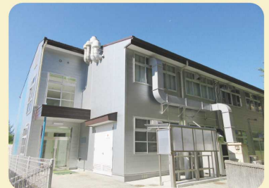
金属新素材研究センター 外観