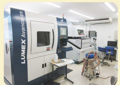
レーザービーム型金属用3Dプリンタ