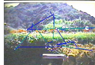
視線解析による景観認識の把握